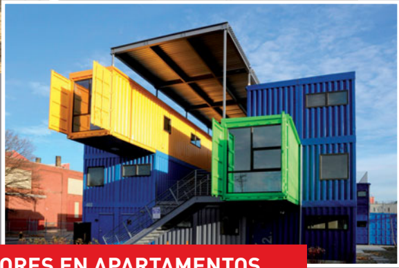
REHABILITACIÓN DE CONTENEDORES EN APARTAMENTOS