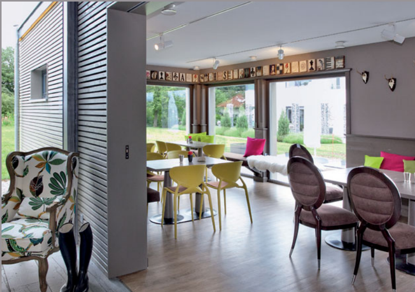
Salón de té de muestra (Alemania) - Techos CLIPSO Realización: SchwörerHaus KG, Jürgen Lippert