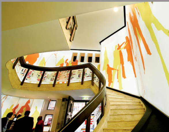
Twynstra Gudde - Países Bajos (pared impresa retroiluminada) Arquitecto: Kubik - Realización: I-OMS NL