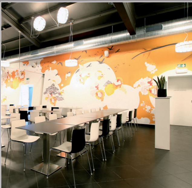
DarDar-Roeselare - Bélgica (proyecto acústico e impreso) Arquitecto: Dtonic - Realización: MonaVisa

Desde 2003, clipso se ha convertido en un precursor de la impresión digital, contando con su propio departamento clipso design® que ofrece soluciones llave en mano y a la carta.