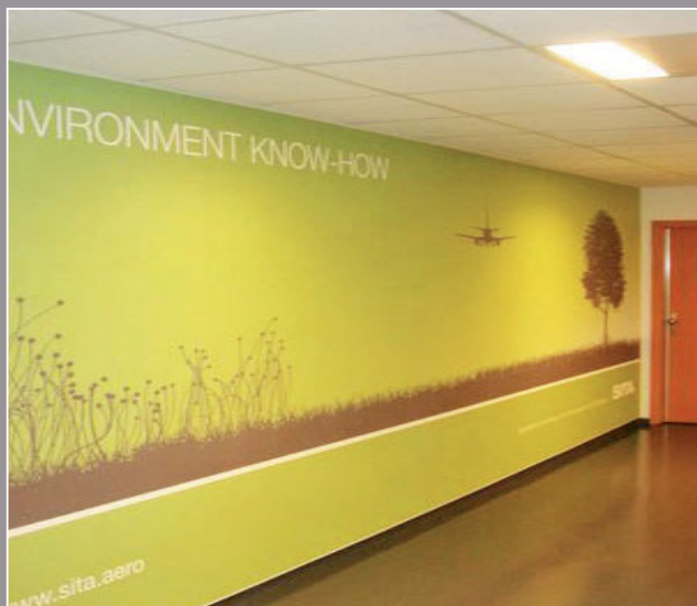
SITA - Suiza (pared impresa) - Realización: Reflecta

Por último, el mayor valor añadido consistía en poder proyectar la imagen de la empresa a través de su propio entorno. En el pasado, se trataba de una inversión costosa y compleja, pero en la actualidad clipso es la solución definitiva.