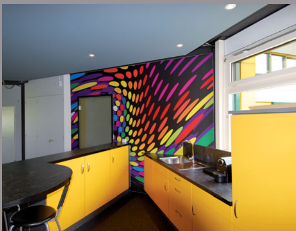
Cocina de bar - Suiza (techo estándar y pared impresa) Realización: Clipso