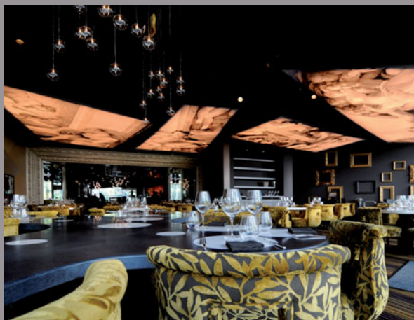
The Last Supper - Luxemburgo (marcos impresos) - Fotos: Andrés Lejona Arquitecto: Miguel Cancio Martins - Realización: Bert'Déco