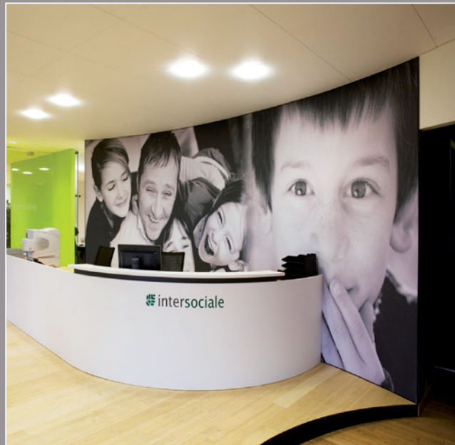
Intersociale-Brussels - Bélgica (proyecto acústico e impreso) Arquitecto: Avanti Design - Realización: MonaVisa

Además, los revestimientos clipso son resistentes al agua y al calor y tienen la clasificación B-s1,d0 (ex M1).