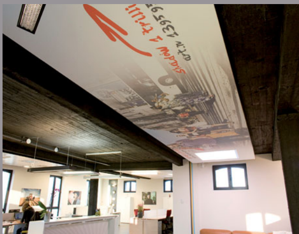
Belgtrade-Wattson-Deinze - Bélgica (techo impreso) Realización: MonaVisa

Clipso Productions 5 rue de l'Église 68 800 Vieux-Thann Francia