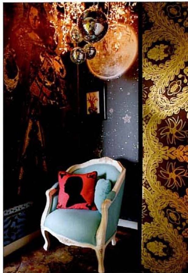
DIVINE ALCÔVE. Sous la protection d'une belle Vierge baroque imprimée sur une bâche (Clipso). Guirlande lumineuse (Habitat). Fauteuil et coussin (La Redoute). « Une niche un peu crypte avec loupiotes », pour les moments de méditation.