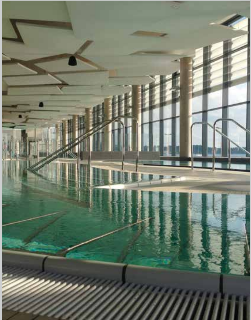
Thermal baths in Balaruc - France - Installation: TELIA