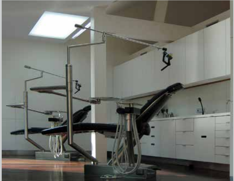
Kelderman Orthodontie - Zeist The Netherlands - Architect: ARHK Installation: POLYPLAFOND

SO CLEAN ermöglicht es, einladende und angenehme Räume zu schaffen und dabei die hygienischen Bedingungen von Entspannungsbereichen zu optimieren.