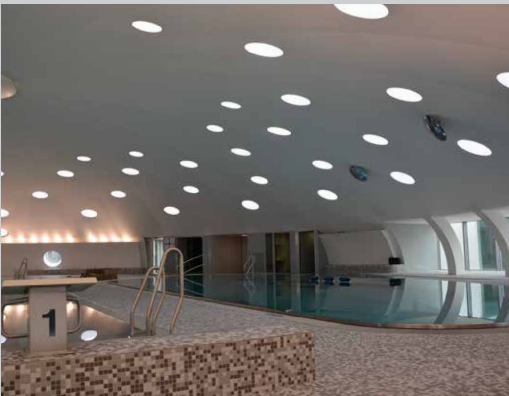
Water sport centre in Lingolsheim - France Installation: VOLTAIRE, LOUIS & LA BERGERE

Sanitized® prevents mould from forming and restricts the growth of microbes, fungi, mildew, rot and algae by disrupting microbial development and eliminating key sources that sustain their growth. As a result, mold and bacteria cannot form or spread.