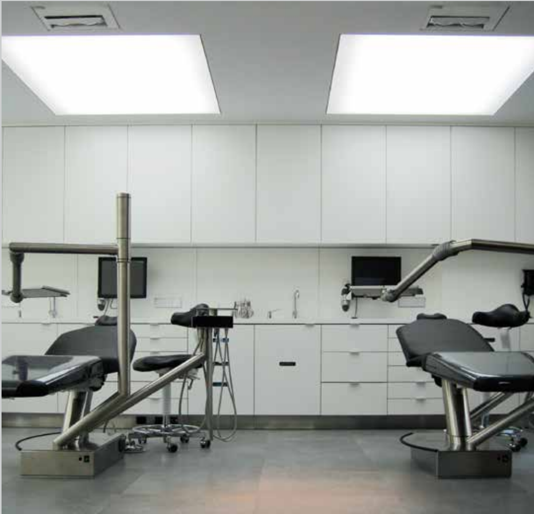
Kelderman Orthodontie - Zeist, The Netherlands - Architect: ARHK Installation: POLYPLAFOND