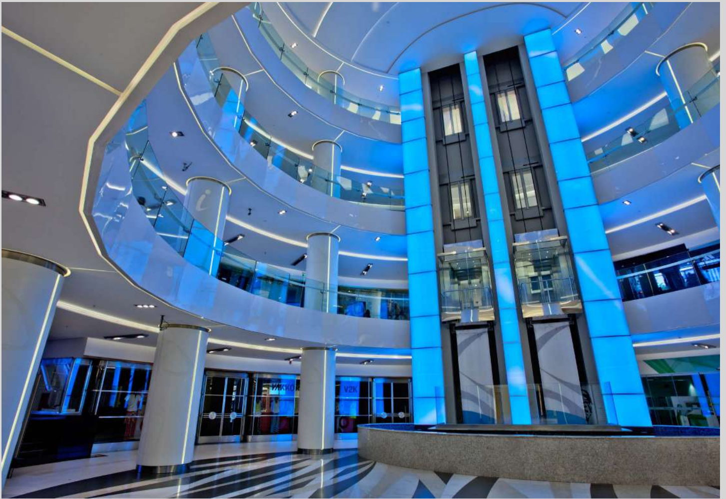
Centre commercial Akmerkez - Turquie - Revêtement rétroéclairé - Architecte : Filiz Yilmaz - Réalisation : TTI Elektrik Elektronik