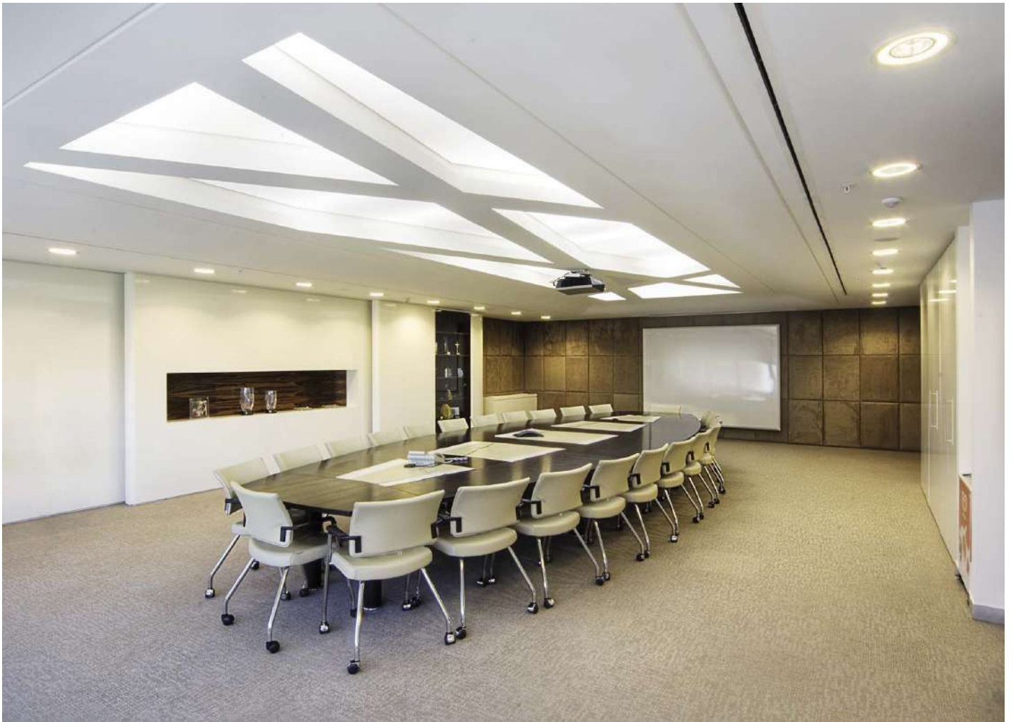
Salle de réunion UNILEVER - Plafond avec structure rétroéclairée