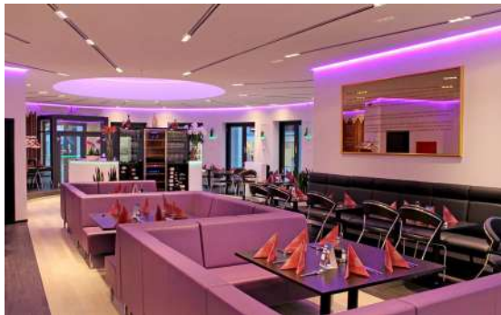
Restaurant - Plafond acoustique avec intégration de chemins lumineux et rétroéclairage - Danemark Réalisation : RALBO

Il est donc indispensable aujourd'hui de l'adapter à nos intérieurs, qu'ils s'agissent de son lieu de travail comme de son "chez-soi", pour évoluer dans une ambiance agréable et qui nous ressemble.