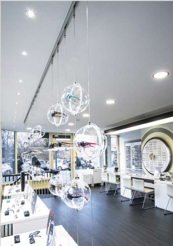
Magasin d'optique - Intégration de spots et caissons rétroéclairés - Allemagne - Réalisation : Optimaler

Embellissez tout votre espace avec un effet lumineux qui simule la lumière du jour.