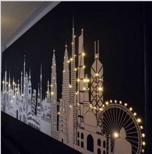
Mur imprimé avec fibre optique intégrée - France - Réalisation : CLIPSO PRODUCTION

Embarquez dans les étoiles avec les fibres optiques intégrées dans nos toiles ! Aux murs ou aux plafonds vous créez ainsi une ambiance unique qui fait rêver.