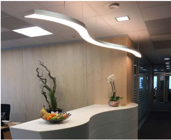
Structures aluminium rétro-éclairées - Luminaire Suisse - Réalisation : Linsi-tech

La compatibilité des LED avec nos toiles vous offre une personnalisation totale : un revêtement imprimé avec l'image de votre choix ou une création d'artiste créeront une atmosphère unique.