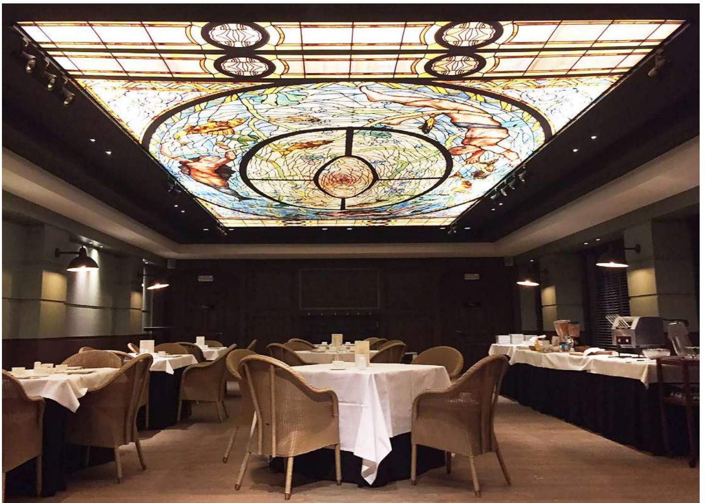
Restaurant - Belgique - Plafond imprimé rétroéclairé - Réalisation : MONAVISIA