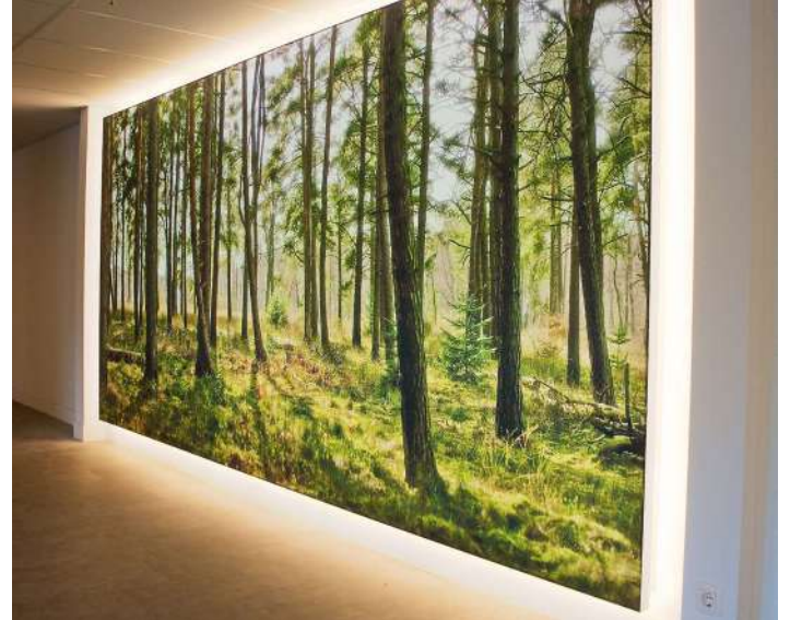
Caisson mural - Belgique - Revêtement imprimé rétroéclairé Réalisation : City Outdoor

Nos ateliers sauront créer le luminaire dont vous avez besoin, nous concevrons pour vous la forme la mieux adaptée et vous proposerons diverses intensités lumineuses. Cette forme sera moderne, élégante, esthétique ou épurée... Conforme à vos envies !