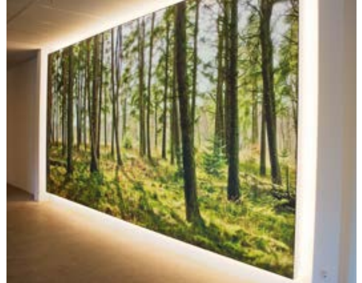
Caisson mural - Belgique - Revêtement imprimé rétroéclairé Réalisation : City Outdoor

Envie de jouer sur l'intensité lumineuse ou les couleurs ? Là encore l'association d'un certain type de LED vous permettra de créer cette ambiance personnalisée douce et chaleureuse.