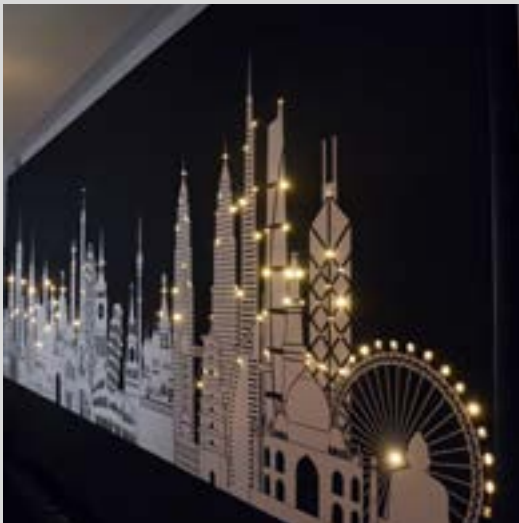
Mur imprimé avec fibre optique intégrée - France - Réalisation : CLIPSO PRODUCTION

Embarquez dans les étoiles avec les fibres optiques intégrées dans nos toiles ! Aux murs ou aux plafonds vous créez ainsi une ambiance unique qui fait rêver.