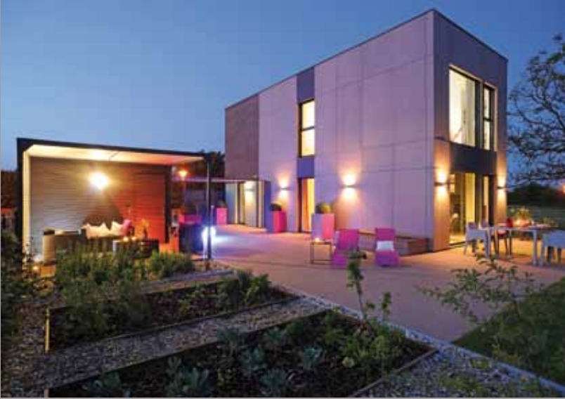
Maison témoin Modulife (France) - Murs et plafonds CLIPSO Réalisation : Groupe MCP, technologie MODULIFE