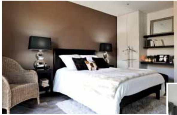
Maison témoin Modulife (France) - Murs et plafonds CLIPSO Réalisation : Groupe MCP, technologie MODULIFE