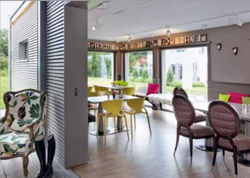
Salon de thé témoin (Allemagne) - Plafonds CLIPSO Réalisation : SchwörerHaus KG, Jürgen Lippert