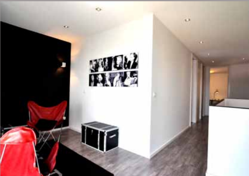
Maison témoin Modulife (France) - Murs et plafonds CLIPSO Réalisation : Groupe MCP, technologie MODULIFE