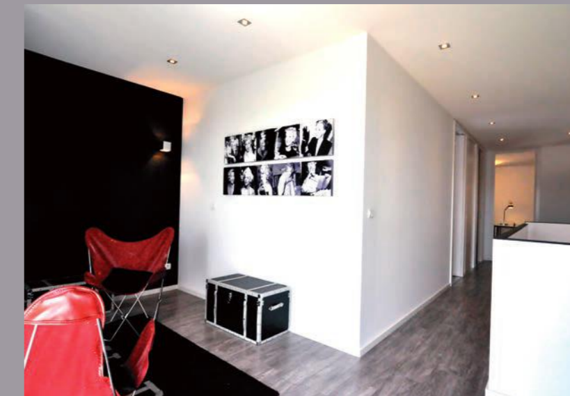
Musterhaus Modulife (Frankreich) - Wände und Decken von CLIPSO Durchführung: Unternehmensgruppe MCP, MODULIFE-Technologie