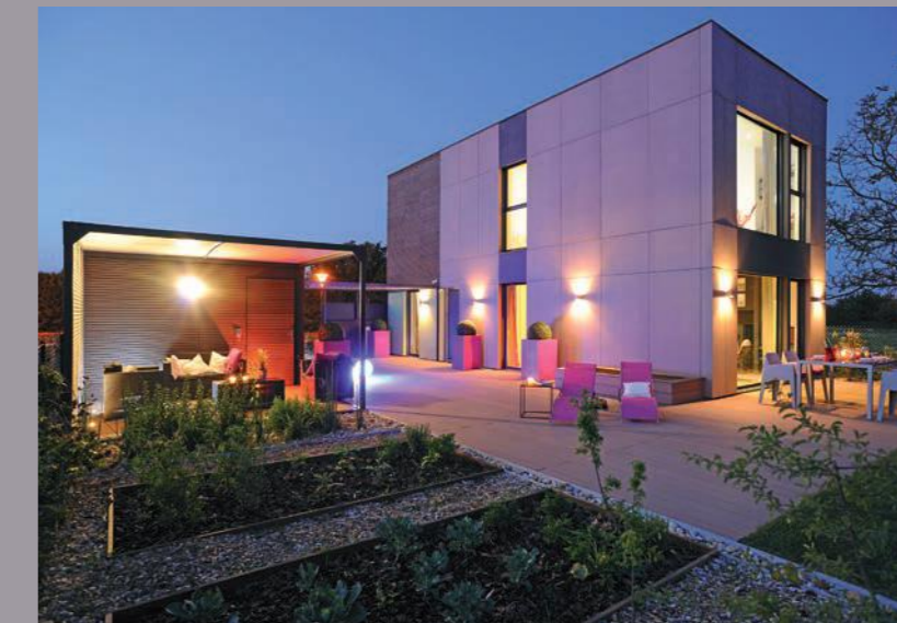
Musterhaus Modulife (Frankreich) - Wände und Decken von CLIPSO Durchführung: Unternehmensgruppe MCP, MODULIFE-Technologie - Foto Erick Saillet

RM_C-DocConstomod - Allemand - Ed. 12/2012 - Photos : Shutterstock - Conception et Réalisation : Service Marketing & Communication de CLIPSO - Délicat Imprimé Vert