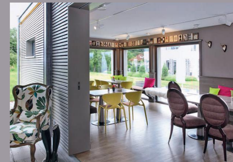
Muster-Café (Deutschland) - CLIPSO-Decken Durchführung: SchwörerHaus KG, Jürgen Lippert