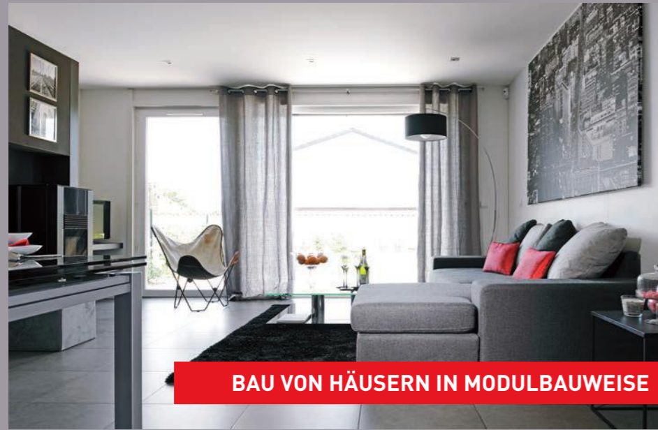
BAU VON HÄUSERN IN MODULBAUWEISE

Musterhaus Modulife (Frankreich) - Wände und Decken von CLIPSO Durchführung: Unternehmensgruppe MCP, MODULIFE-Technologie