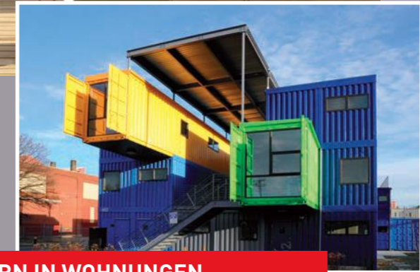
UMBAU VON CONTAINERN IN WOHNUNGEN