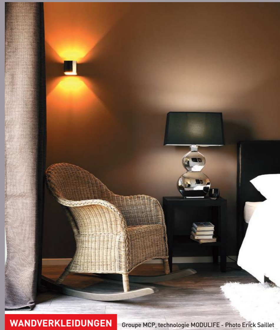
WANDVERKLEIDUNGEN Groupe MCP, technologie MODULIFE

CLIPSO Productions 5 rue de l'Église 68 800 Vieux-Thann Frankreich